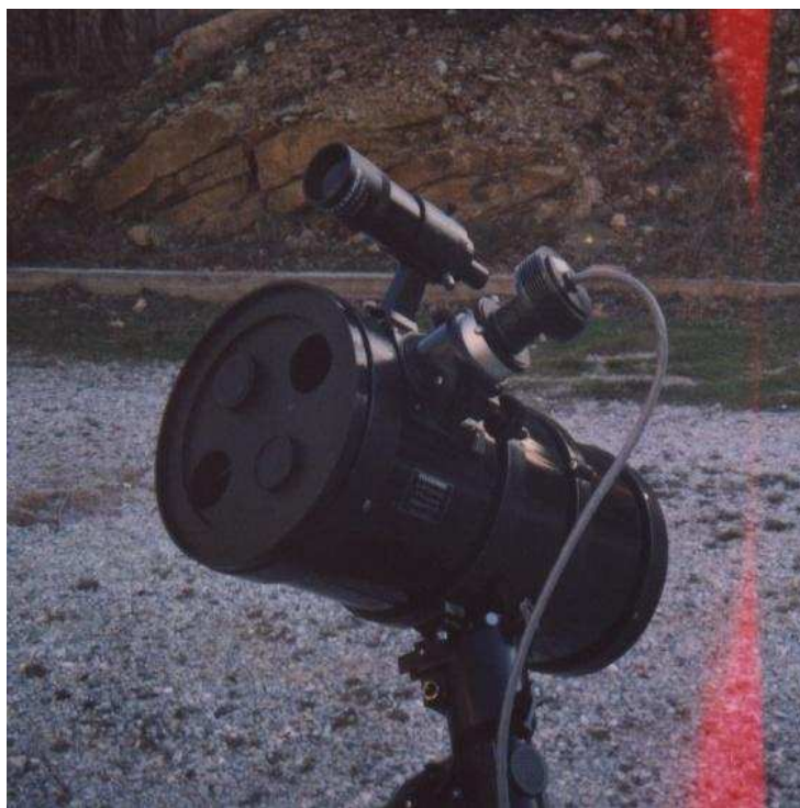
Εικόνα 1 : Το τηλεσκόπιο Celestron GN-8. Ένα από τα τηλεσκόπια που χρησιμοποιεί το Αστεροσκοπείο Θεσσαλονίκης για τις μετρήσεις Seeing στον Χολωμώντα Χακλιδικής (Αστρονομικός Σταθμός Χολωμώντα Αστεροσκοπείου Θεσσαλονίκης). Διακρίνεται η μάσκα DIMM και η CCD ST-4.

Πριν αρχίσουμε μια μέτρηση Seeing με την μέθοδο DIMM χρειαζόμαστε να φτιάξουμε μια μάσκα DIMM για το αντίστοιχο τηλεσκόπιο με το οποίο θα μετρήσουμε. Η μάσκα DIMM δεν είναι τίποτα άλλο από μια μάσκα από χαρτόνι (ή πλαστικό) με δύο τρύπες. Η μάσκα αυτή μπαίνει μπροστά στο τηλεσκόπιο και οι τρύπες ανοίγονται κυκλικές και τοποθετείται εκεί που εφαρμόζει το καπάκι του τηλεσκοπίου (εικόνα 1).